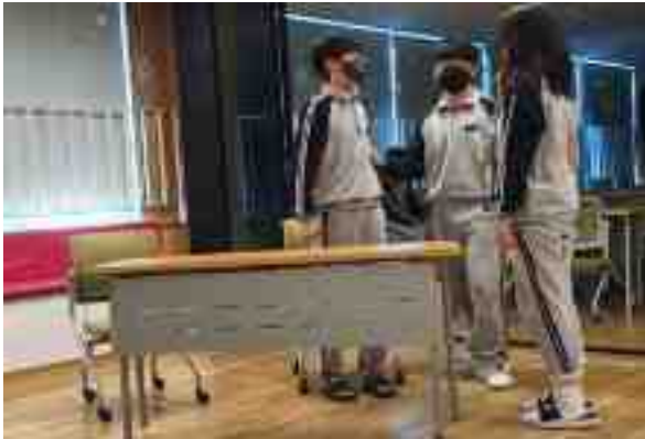
[캐릭터를 직접 연기하는 모습]