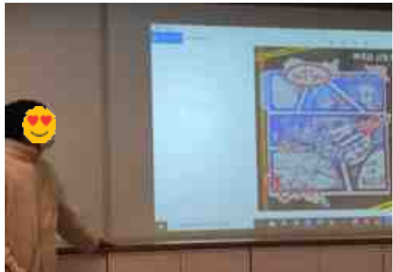
[시점을 바꾸어 분석하여 발표함]