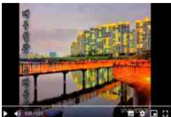
[ 지역 소개 브이로그(월광수변공원) ]