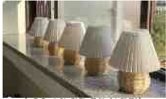
[ 오후 수업 라탄 공예 (스탠드)]