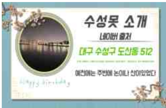
[ 지역 소개 카드뉴스(수성못) ]