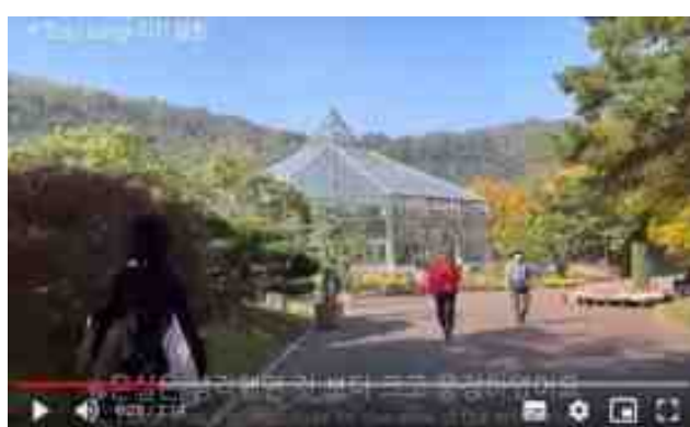
[지역 소개 브이로그(수목원)]