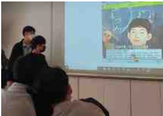
[소설 속 인물에 관한 투표 진행]