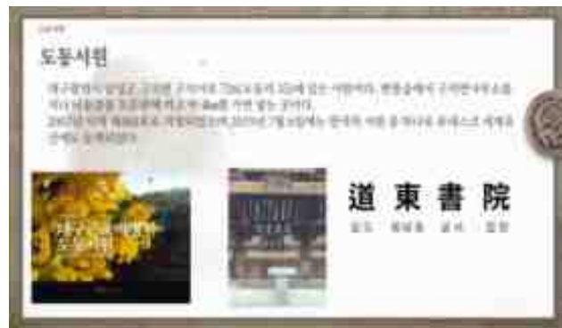
[ 지역 소개 PPT(도동서원) ]