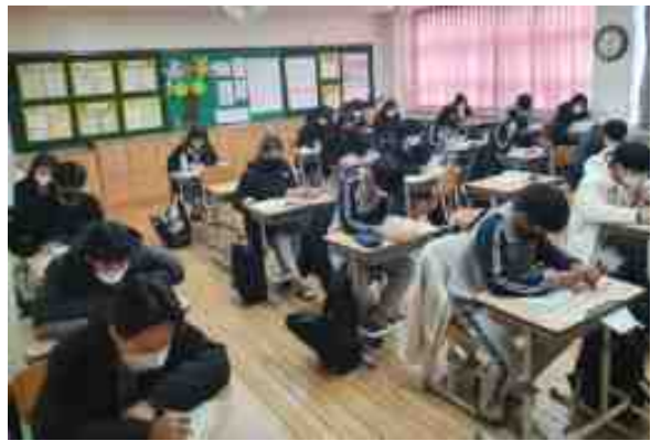
[ '마당 깊은 집' 소설 읽기 ]