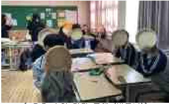
[ 오후 수업 라탄 공예 (바구니)]