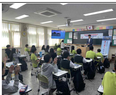
2023.10.05.(목) -독도 알리기 교육-