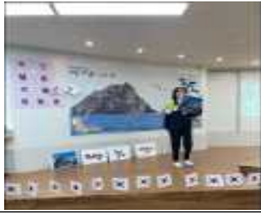
▲독도 가상 방문 포토존