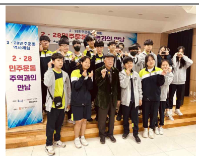
2023.11.08.(수) -2·28 민주운동 역사체험-