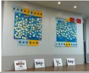
▲독도 알림판 작성