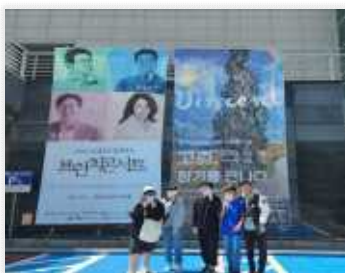
< 아양아트센터에서 전시한 '고흐, 향기를 만나다' 에서 고흐 작품 감상 및 설명 듣기 >