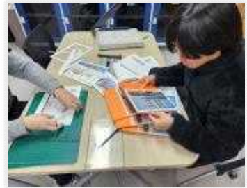
< 달력 만들기 >