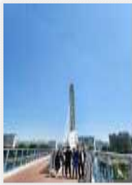
<해맞이다리에서 보라본 금호강>