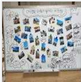
< 체험한 작품전시 >