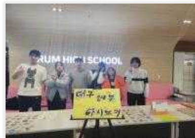
< '대구경북 다시보기' 동아리 활동 마무리 >