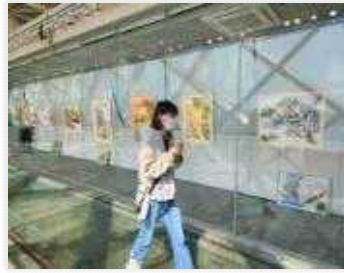
<아양기차길 전시 관람>