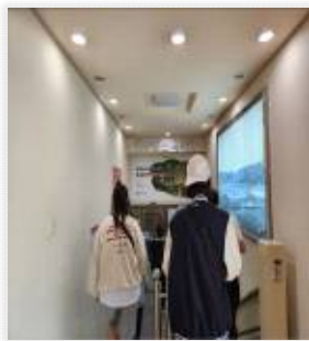
<대구향토 박물관 관람>