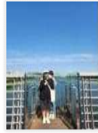
<아양기차길에서 바라본 금호강>