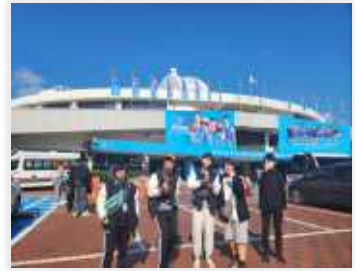
< 대구실내체육관 방문 >