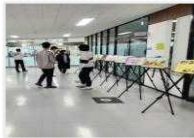
< 급식실 이동 시 미술 작품 구경 >