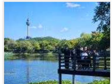
<성당못 테크길 걷기>