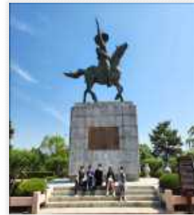
<곽재우 동상과 의병 활동에 대해 알기>