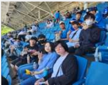
< 삼성라이온즈 응원 >