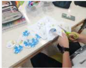
< 뱃지 만들기 >