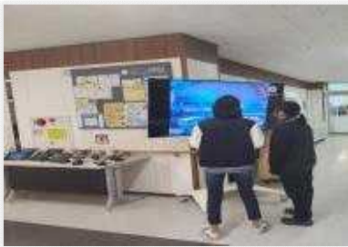
< 체험한 활동으로 만든 영상을 TV로 반영 >