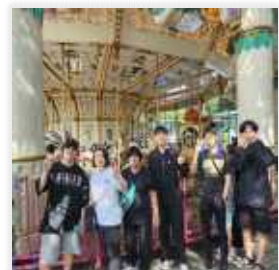
< 이월드에 방문하여 다양한 놀이기구 이용 >