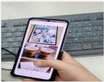
< 휴대폰과 컴퓨터를 활용하여 네이버 블로그 작성 >