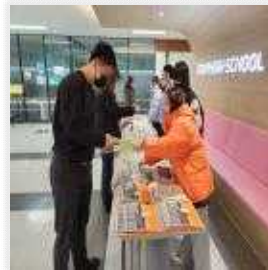
< 결과물 배부 >