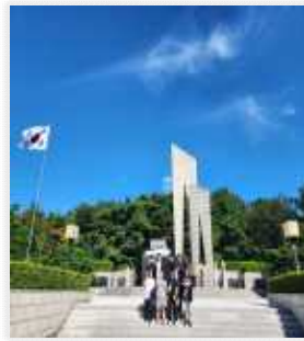
<2.28민주화운동과 항일독립운동 기념탑>