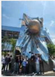
< 라이온즈파크 방문 >