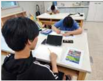
< 체험활동 그리기 >