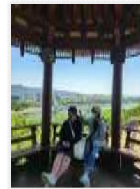
<해맞이공원에서 바라본 금호강>