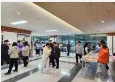
< 급식 후 작품 안내 및 결과물 배부 >