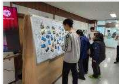
< 대구 지역 체험한 활동사진 전시 >