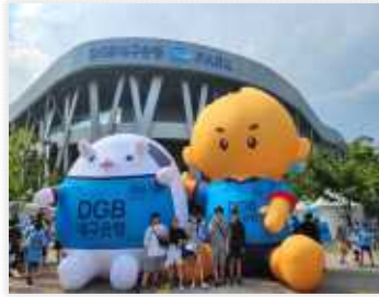
< DGB대구은행파크 방문 >