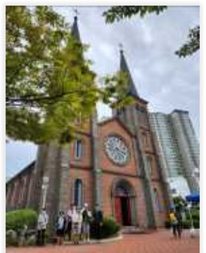
< 대구의 근대 골목 역사가 있는 청라인덕, 3.1운동계단, 계산성당 둘러보기>