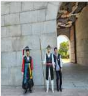
<영남제일관의 파괴와 축조 배경을 알기>