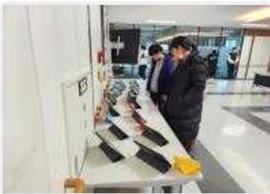
< 체험한 장소별로 태블릿에 담아 영상 재생 >