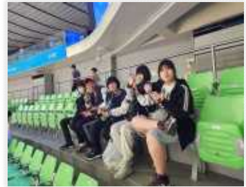
< 한국가스공사 페가수스 응원 >