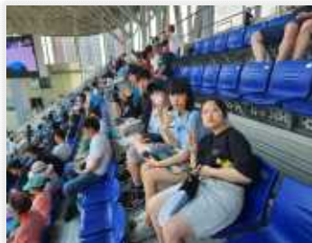
< 대구 fc 응원 >